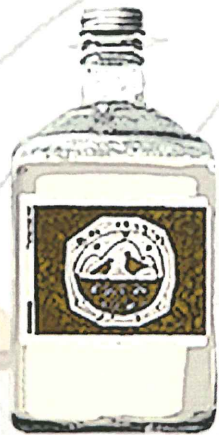
甘口 クラシックラベル