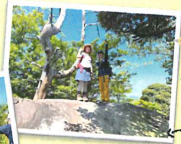
つぶせ岩の上でパチリ☆