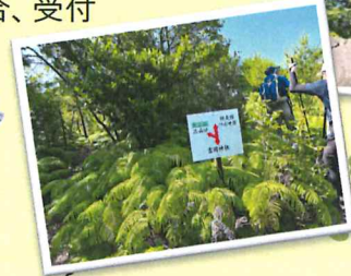
立派なシダの群生