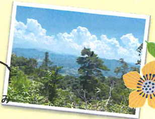
山頂から望む美しい山並み