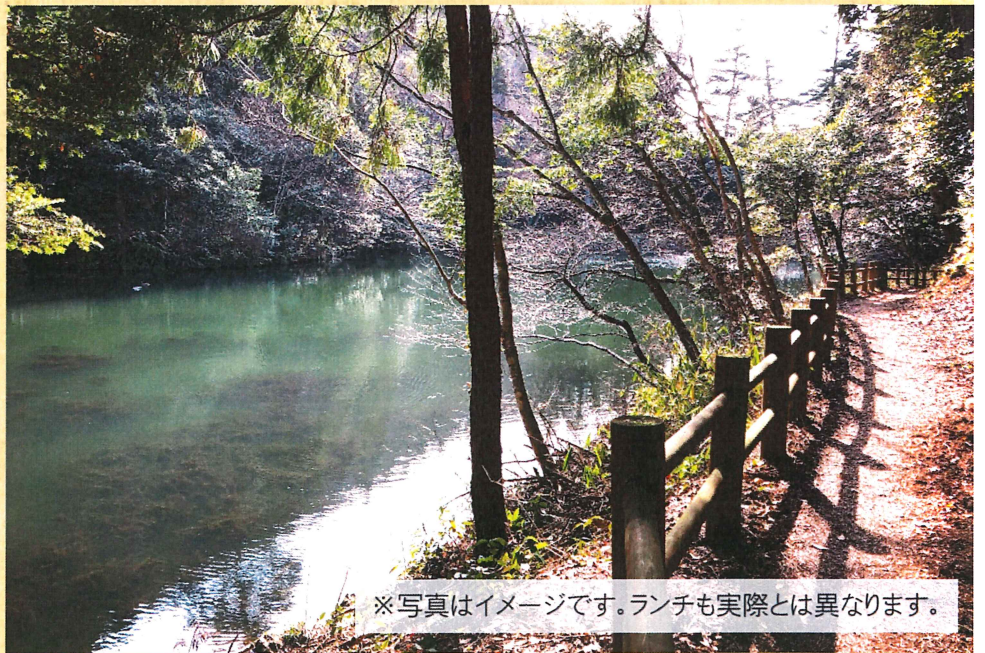
※写真はイメージです。ランチも実際とは異なります。